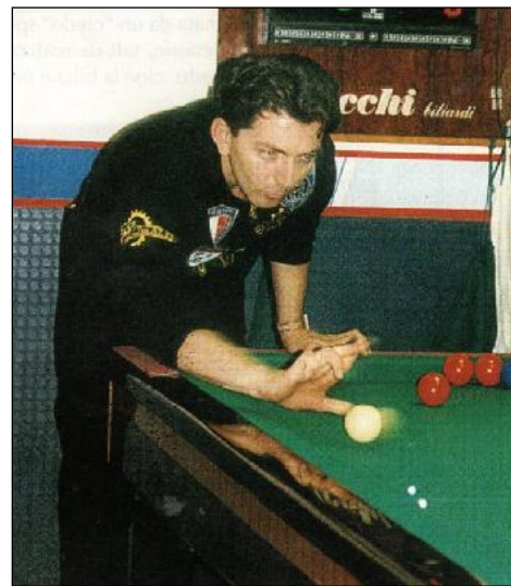
I CINQUE TIPI DI IMPUGNATURA PIU' UTILIZZATI IMPUGNATURA A BRACCIO ALZATO".

Impugnare la bilia con dito "pollice/indice/medio"; trovare, poi, la giusta coordinazione ed impostazione per il "lancio bilia".