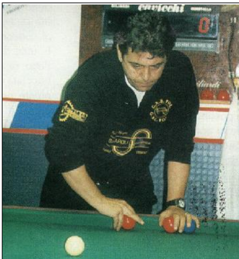
IMPUGNATURA PER L'EFFETTO BILIA DA SPONDA SINISTRA A DESTRA

Impugnare la bilia con "pollice/indice/medio/- anulare" in posizione verticale; imprimere, poi, la rotazione in senso antiorario con i soli indice e anulare.