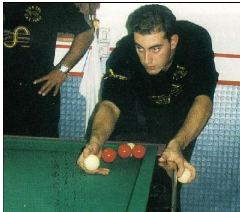
IMPUGNATURA A "STRISCIO CLASSICO" Appoggio bilia sul biliardo; piegamento a 90° del dito medio nella parte inferiore della bilia; leggera pressione ai lati della bilia stessa, con pollice e indice; strisciare il tutto sul biliardo con movimento orizzontale.