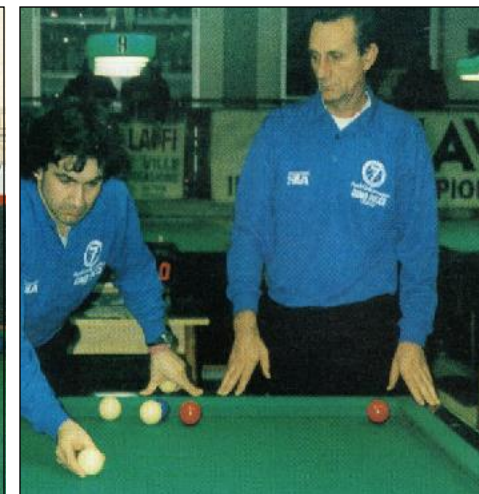
IMPUGNATURA STRISCIATA A "TENAGLIA" Appoggio bilia sul palmo del dito indice; leggera pressione del pollice sulla parte superiore della bilia stessa; strisciare sul piano biliardo con la parte dorsale delle dita con movimento orizzontale "a mò di stecca".

Nella specialità a coppie, il giocatore d'accosto assume in maniera ancor più rilevante il ruolo di vero regista: indica (detta) la giocata e la tattica da seguire, finendo per assumersi tutte le responsabilità del gioco di coppia. Da parte sua, invece, il compagno deve tesaurizzare, mettendo a buon frutto i vantaggi del gioco d'accosto, realizzando punti con l'esecuzione della bocciata.