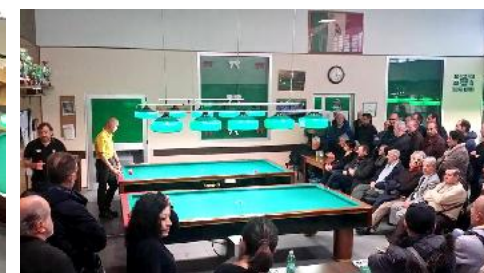
Panoramica del pubblico nel torneo del Ambrogino D'Oro