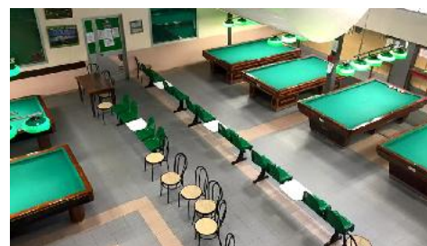
Sala Biliardi del c.s.b. Giambellino Piazza Tirana, 18 Milano