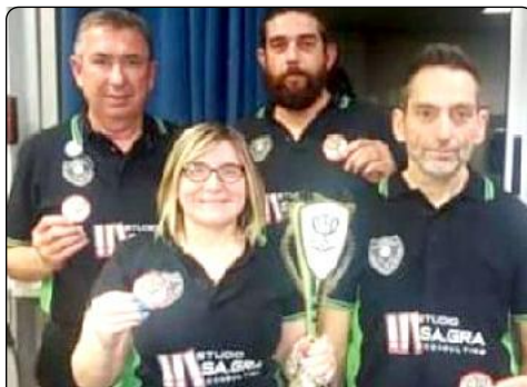
Squadra "Castelferro 1"