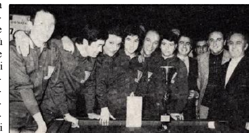
Ecco la formidabile squadra della COOP. ANZOLA, che ha vinto per la quinta volta consecutiva il Campionato Provinciale Bolognese a squadre.

Il C.R.I.B. (Centro Raccolta Italiana Biliardo)