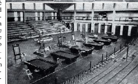
Panoramica dei perfetti 6 biliardi, sui quali è stato disputato il campionato Italiano 1973/1974